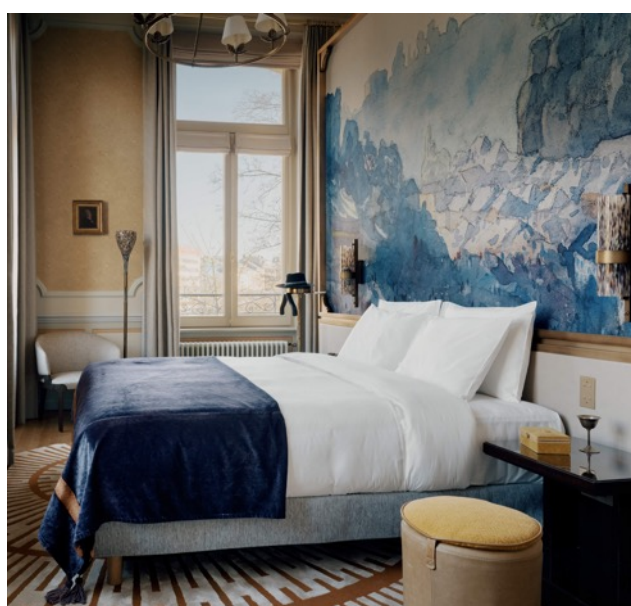
© Tristan Auer et Amaury Laparra