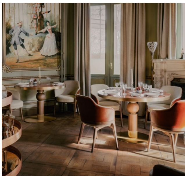
© Tristan Auer et Amaury Laparra